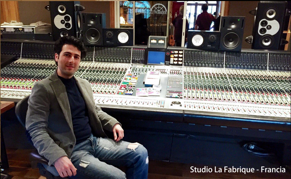
Studio La Fabrique - Francia