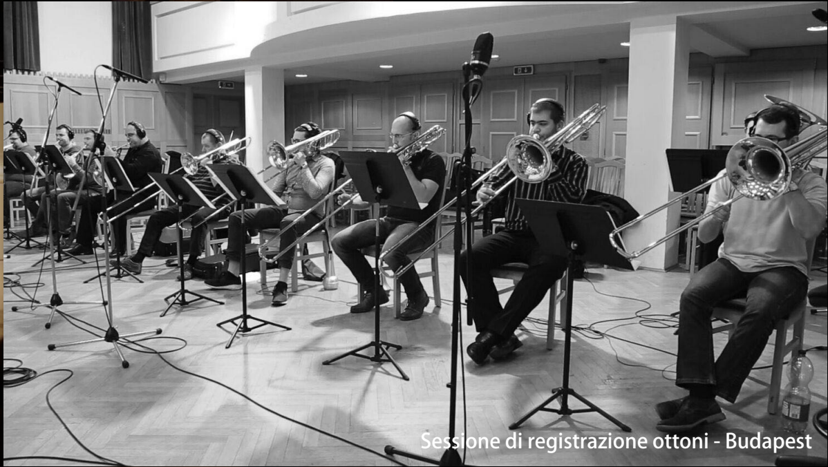
Sessione di registrazione ottoni - Budapest