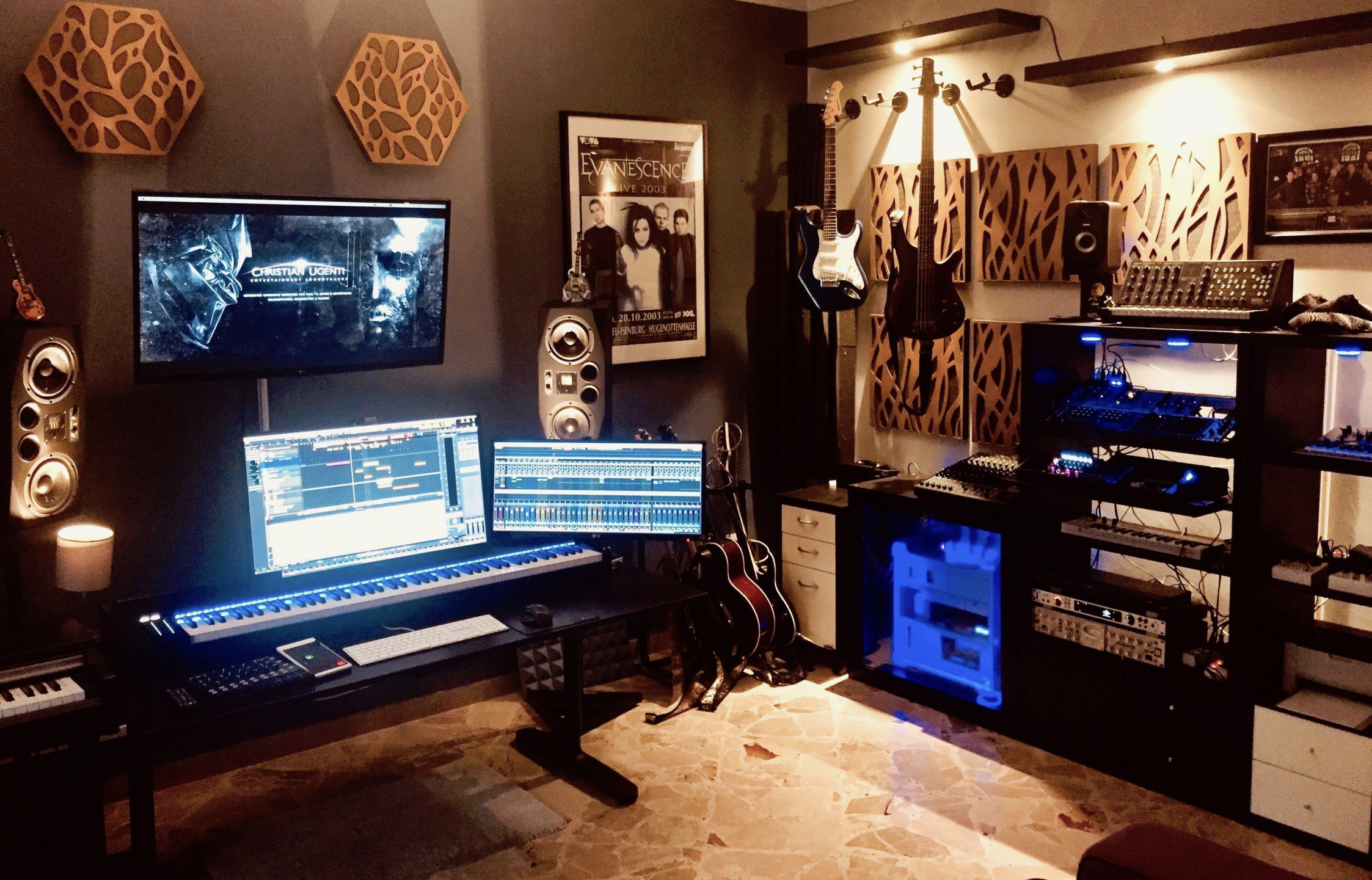
Christian Ugenti - Studio privato in Puglia